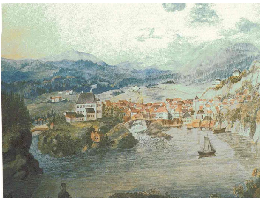
Bildet viser Skien under flommen i 1822 (Akvarell av Severin Schweder)